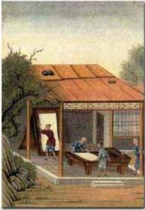
Fasi della fabbricazione della carta nell' antica Cina. Dall' opuscolo edito dalla Bibliothèque de L' Institut de France (Paris s.d.).